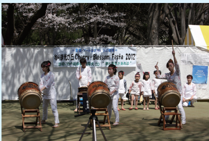
Cherry Blossom Festa 2012