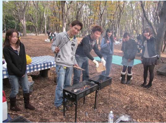
十一月 光が丘公園でバーベキュー