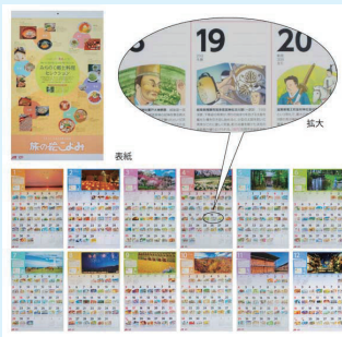
Illustrator of the year 2011