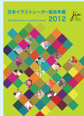
一月 日本イラストレーター協会年鑑二〇一二を出版

A4フルカラー104ページ 初版1,000部 収録作家94名 販売価格1,050円(税込)