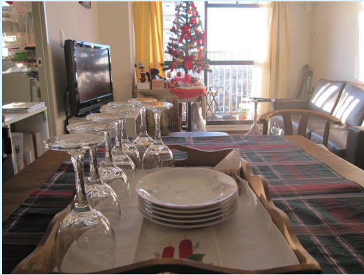
十二月 クリスマスパーティー